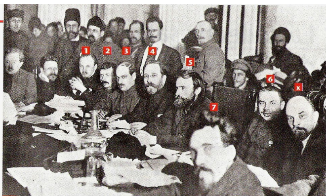
3 L'élimination des membres du bureau politique du parti communiste. Après la mort de Lénine (X) en janvier 1924, ses plus proches compagnons sont éliminés par Staline : 1. Boukharine (exécuté), 2. Tomski (« suicidé »), 3. Lachevitch (disparu), 4. Kamenev (exécuté), 5. Préobrajenski (exécuté), 6. Sérébiakov (exécuté), 7. Rykov (exécuté).